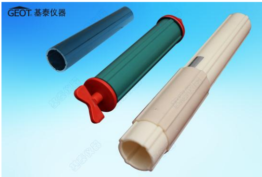
图 1：PVC、ABS 测斜管

广泛应用于混凝土大坝、隧道建设、石油、矿山与冶金开采、港口建设、地质灾害的预防、高层建筑物及其基础、高等级公路、铁道等岩土工程中。与测斜仪器配合使用，以测量铅垂方向的水平位移、或水平方向的剖面沉降等，作为固定倾斜仪、垂直活动测斜仪或水平活动测斜仪（剖面沉降仪）的导轨使用。根据现场工况不同，选择不同材质的测斜管。